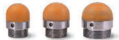
Antiabrasivas, para la protección de encofrados Antiabrasive elements for the protection of formwork Antiabrasives pour la protection des coffrets